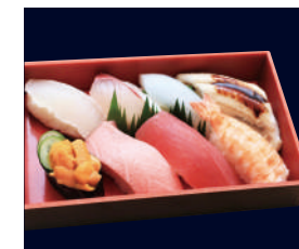
▲ 上にぎり [かに付] (中トロ含む上ネタ8貫) 2,685円 (税込 2,900円)