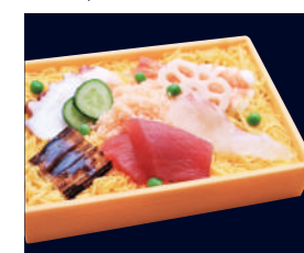
▲ 並ちらし寿司 1,388円 (税込 1,500円)