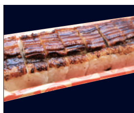
▲ あなご押し寿司 (1本) 2,129円 (税込 2,300円)