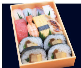
▲ にぎり巻寿司盛合せ (並にぎり8貫・並巻4貫) 1,759円 (税込 1,900円)