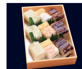
▲ 箱寿司 1,481円 (税込 1,600円)