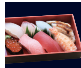
▲ 上にぎり [いくら付] (中トロ含む上ネタ8貫) 2,500円 (税込 2,700円)