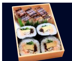
▲ 上巻あなご箱 1,481円 (税込 1,600円)