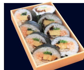
▲ 上巻 (太巻・1本) 1,481円 (税込 1,600円)