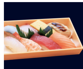
▲ 並にぎり (8貫) 1,342円 (税込 1,450円)