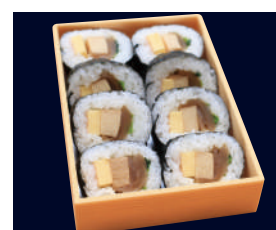
▲ 並巻 (太巻・1本) 740円 (税込 800円)