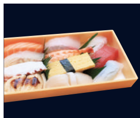
▲ 得盛にぎり (11貫) 1,851円 (税込 2,000円)