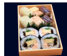
▲ 上巻箱寿司 1,851円 (税込 2,000円)